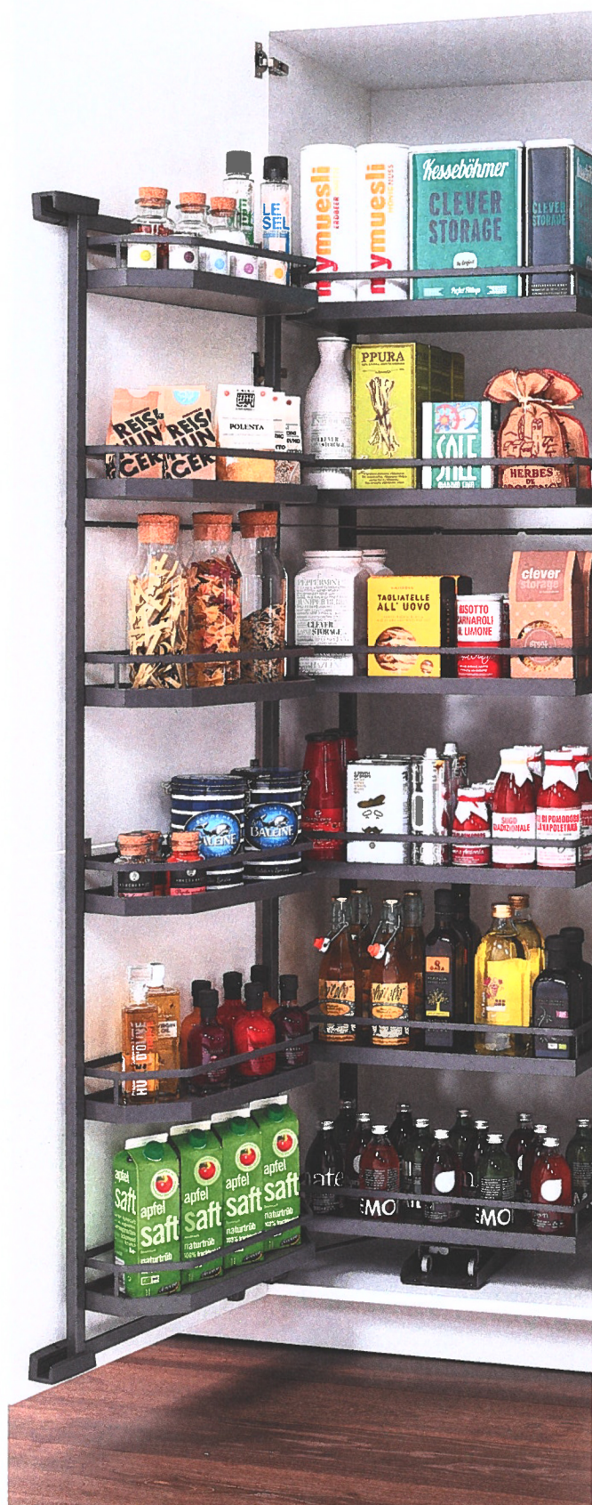
Tandem, een uitdraaiend element voor kolomkasten.

Op Prowood liggen er ook 10.000 nieuwe catalogi te wachten. Na enkele jaren was de bijbel van Van Opstal aan een herziening toe. In de catalogus - in groot en pocketformaat - vind je het overzicht van de meer dan 30.000 artikelen in meubelbeslag, kastinrichting en accessoires zoals verlichting en afvallemmers. Afspraak op stand 2220! ■